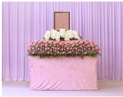
花祭壇 A タイプの場合