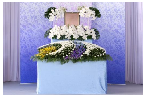
花祭壇 B タイプの場合