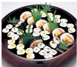
通夜料理 75名 様対応分

各祭壇に下記項目が共通して含まれます。人数の超過が無ければ追加料金はありません。