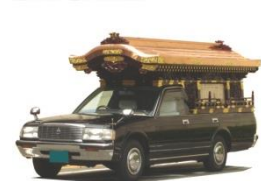
霊柩車・マイクロバス